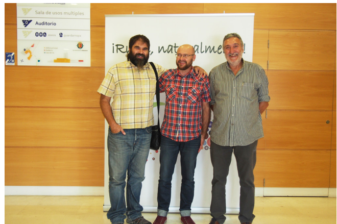
CDR Alt Maestrat