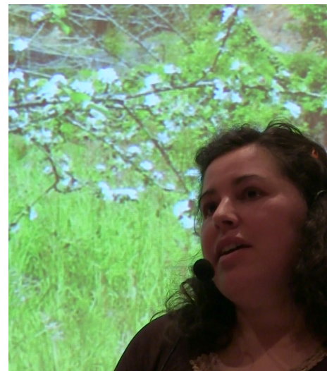
Presidenta Plataforma Rural