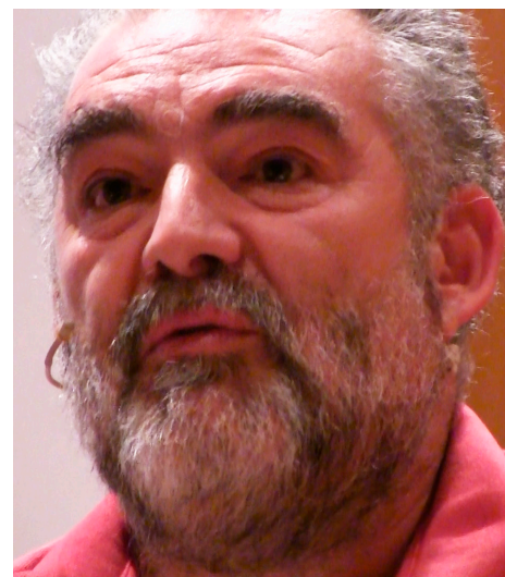
Coordinador Unión de Campesinos (UCCL)

L a celebración del 25 aniversario de COCEDER ha sido una oportunidad para hacer visible toda la riqueza del medio rural tan poco presente en los lugares de ciencia, en los medios de comunicación, en el arte, en las políticas.... Y sin embargo tan imprescindible para la vida del ser humano, según pudo analizarse en la mesa redonda que siguió a la Ponencia Marco del encuentro sobre "Políticas Públicas y Medio Rural".