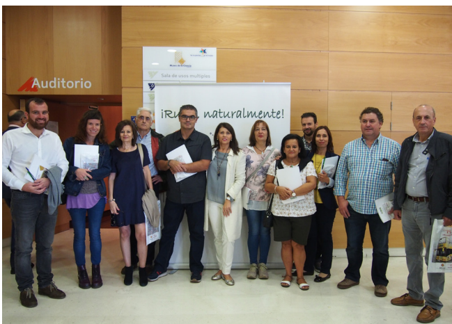
CDR El Prial