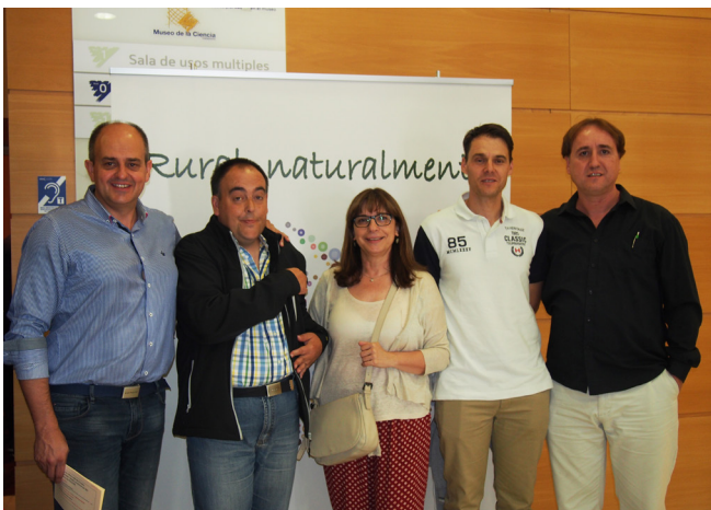
CDR Asociación Guayente