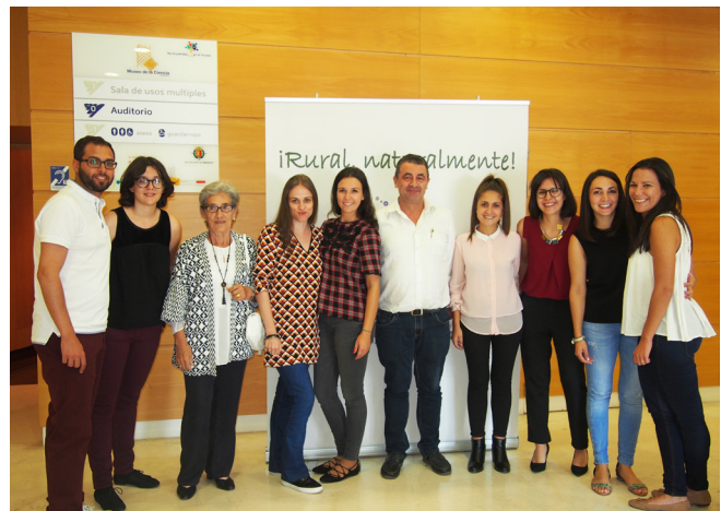
CDR Portas Abertas