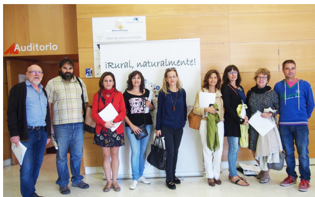
CDR La Safor