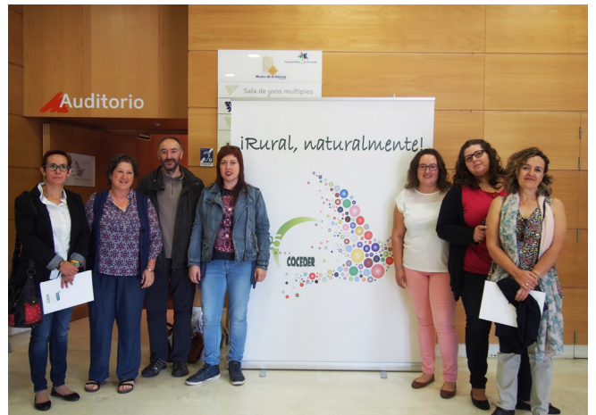
CDR Asociación Cultural Grío