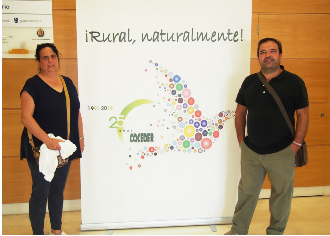
CDR Montaña y Desarrollo