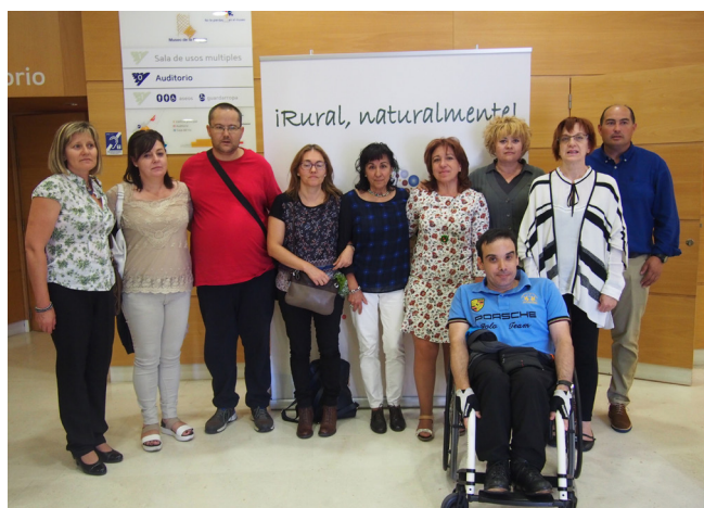
CDR Carrión de los Condes