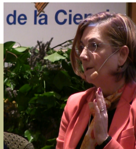
Directora General Desarrollo Rural MAGRAMA

Este espacio de encuentro nos ayudó, como no podía ser de otra manera, a poner sobre la mesa la necesidad de: cambio de los criterios de ayuda para la incorporación y el mantenimiento de los/as jóvenes en el medio rural, una legislación que fomente las pequeñas producciones de calidad y la transformación artesanal de los alimentos, la adaptación de los servicios públicos a la realidad poblacional y territorial de estos espacios, el cuidado de nuestro patrimonio natural, evitando la contaminación y favoreciendo el mantenimiento de la biodiversidad, etc. Una lucha de todas y todos y en la que COCEDER seguirá a la cabeza.