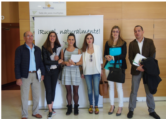
CDR Asociación Pasiega