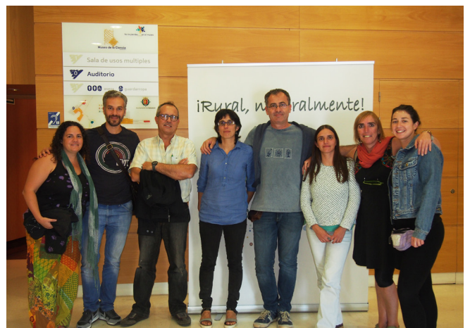
CDR Fundación Edes